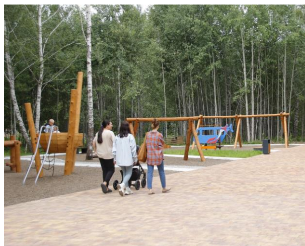
Парк Константина Лагунова

Парк оборудован современной системой освещения, которая создает уютную и безопасную обстановку в вечернее и ночное время.