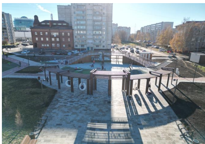
Сквер Выпускников в г. Тобольске