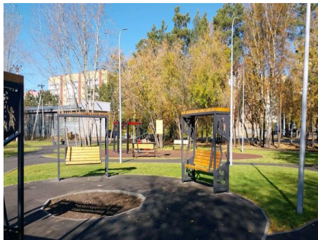
ул. Мусоргского, д. 38, д. 40 после благоустройства

В определении будущего облика общественного пространства на ул. Мусоргского приняли участие более 17,5 тысяч тюменцев, а более 10 тысяч проголосовали именно за реализованный дизайн проект. В результате у жителей микрорайона «Мыс» появилась комфортная зелёная зона с современными детскими игровыми комплексами и спортивными тренажерами. Выполнено устройство новой системы освещения и видеонаблюдения, обустроены тротуары, расширена парковка, а по периметру высажено более 40 яблонь.