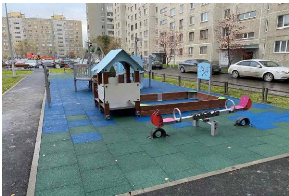
Двор на ул. ул. 50 лет Октября, 50, 54, ул. Одесская, 40 А, 44 после благоустройства

Выполнено благоустройство дворов по следующим адресам: