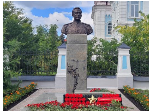
Памятник П.М. Фитину

- Тюменской городской общественной организации ветеранов десантных войск «Союз десантников» на создание передвижной музейной экспозиции на стендах и макетах «История создания и боевой путь Воздушно-десантных войск», на реализацию программы «Есть такая профессия – Родине служить».