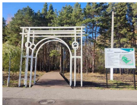
Березовая роща в г. Ишиме

В 2024 году завершен объект в г. Ишиме «Благоустройство Березовой рощи», ставший победителем по итогам Всероссийского конкурса лучших проектов создания комфортной городской среды 2023 года в номинации «Малые города с численностью населения от пятидесяти до ста тысяч человек».