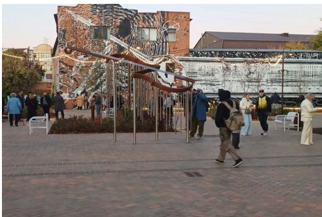
Сквер Леонида Згерского

Благодаря реализации проекта в центре Тюмени появилось еще одно интересное общественное пространство - сквер Леонида Згерского, названный в честь первого директора Тюменской филармонии. В сквере обустроены оригинальные зоны с установкой арт-объектов в виде музыкальных инструментов. Получилось уютное пространство с особой музыкальной атмосферой. В 2025 году его территорию планируют расширить за счет участка, выходящего на улицу Челюскинцев.