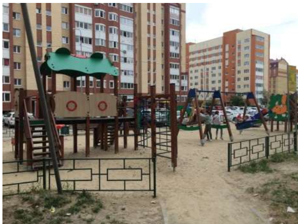
Благоустройство в границах домов № 76,80,84 на ул. Жуковского

По наказу избирателей в 2019 году по моему ходатайству обустроена детская площадка в районе дома № 34 на ул. Домостроителей за счет средств, выделенных из областного бюджета в размере около 1 миллиона рублей.