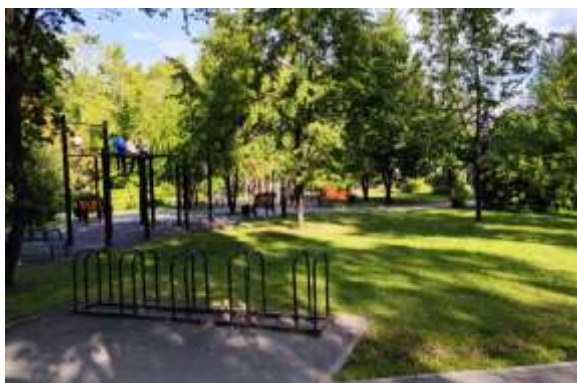
Сквер Тенистый, ул. Республики, 162, г. Тюмень

Основная цель партийного проекта – создание благоприятной современной городской среды, и контроль над осуществлением планов комплектного благоустройства дворовых территорий, формирование системы инструментов общественного участия поддержки инициатив граждан в принятии решений по вопросам благоустройства городов.