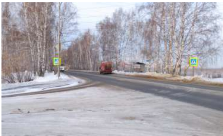
Остановочный пункт на ул. Старый Тобольский тракт, 3-й км в районе поворота на ООО "Хлебокомбинат "Абсолют".

Работники хлебокомбината «Абсолют» обратились с просьбой оказать содействие в обустройстве остановочного пункта на ул. Старый Тобольский тракт, 3-й км в районе поворота на ООО "Хлебокомбинат "Абсолют". В 2020 году в капитальном исполнении обустроен остановочный пункт «Поворот на конно-спортивную базу» (поворот на «Хлебокомбинат Абсолют») по направлению движения в город и пешеходный переход по ул. Старый Тобольский тракт.