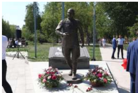
Сквер Якова Неумоева

Всего в Тюменской области с 2017 года по 2020 год благоустроено 445 объектов, из них 312 дворовых территорий и 133 общественных пространства, израсходовано свыше 6 миллиардов рублей, из них около 400 миллионов рублей из федерального бюджета, около 3 миллиардов рублей из областного бюджета, 2 миллиардов 600 миллионов рублей из местного бюджета.