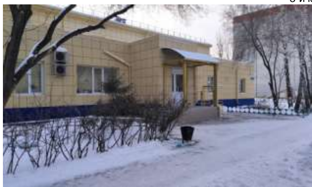
Городская поликлиника № 6, ул. А.Пушкина, 8, Антипино

Жители, проживающие в Антипино, обращались ко мне с просьбой расширить сеть медицинских учреждений в данном районе и провести капитальный ремонт помещения поликлиники № 6 по адресу: ул. Александра Пушкина, 8/1.