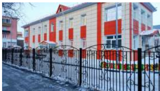
Детский сад № 58, ул. Пржевальского, 52

- капитальный ремонт школы № 5 на ул. Холодильная, 73а и строительство отдельно стоящего корпуса спортивного зала с устройством спортивных площадок на территории школы, а также комплектация спортивного зала необходимым движимым имуществом;