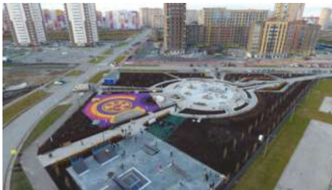
Озелененная территория по ул. Вьюжная, г. Тюмень

Значимым достижением Проекта стало включение озелененной территории по ул. Вьюжная в федеральный реестр лучших реализованных практик (проектов) по благоустройству в 2019 году.