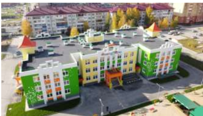
Детский сад № 185, ул. Энергостроителей, 6, корпус 3

В 2020 году разработана проектная документация на строительство детского сада в Антипино, школы в микрорайоне Тура, начаты работы по строительству школы на 1200 учебных мест в районе ЖК "Звездный городок" п. Мыс (завершение строительства планируется в 2021 году).