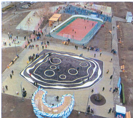
Благоустройство в районе Малышева, 22-24

По моему ходатайству из областного бюджета выделена материальная помощь гражданам, оказавшимся в трудной жизненной ситуации, на общую сумму 245 000 рублей.