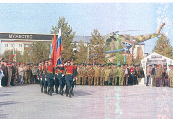
Торжественное открытие Парка пограничников после благоустройства

Одним из значимых объектов благоустройства проекта «Городская среда» в 2022 году стал сквер Пограничников в районе Казарово города Тюмени. Теперь это место, уже не один год горячо любимое многими тюменцами, получило название «Парк Пограничников». В России такой парк открыт впервые. Были проведены масштабные работы по благоустройству на площади почти в 22 тысячи квадратных метров. Также появились новые мемориальные объекты, объекты для активного отдыха и досуга, значительно увеличено количество зеленых насаждений.