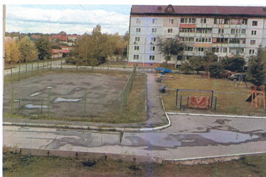
Спортивная площадка до ремонта

По обращению жителей района Матмасы выполнен капитальный ремонт спортивной площадки на ул. Пражская, д. 47.