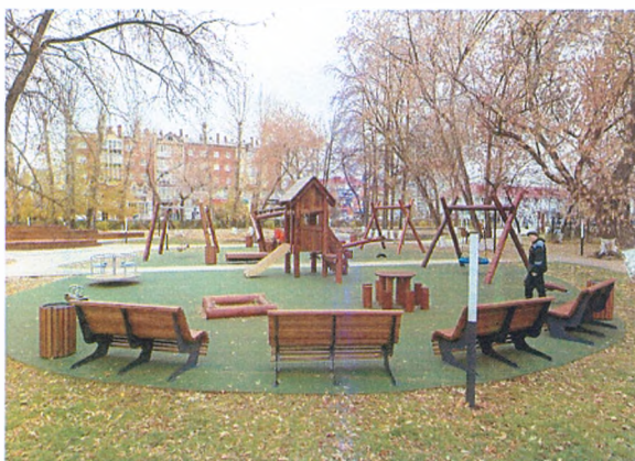
Создание пешеходных зон на улицах Пушкина и Максима Горького и благоустройство сквера возле Дома культуры в городе Ишиме

По итогам конкурса, подведенного в Нижнем Новгороде в 2021 году, заявка города Ишима «Создание пешеходных зон на улицах Пушкина и Максима Горького и благоустройство сквера возле Дома культуры в городе Ишиме» признана победителем в категории «Малые города с численностью населения от 50 до 100 тыс. человек».