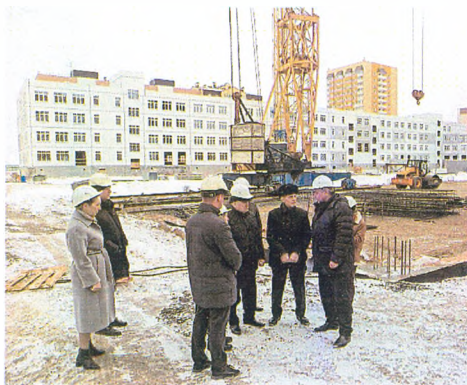
Контрольный осмотр выполнения работ по строительству школы в микрорайоне «Тура»

В 2022 году выполнялись подрядные работы по строительству школы в микрорайоне «Тура», окончание строительства планируется в 2023 году.