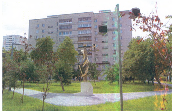
Сквер Юристов, г. Тюмень