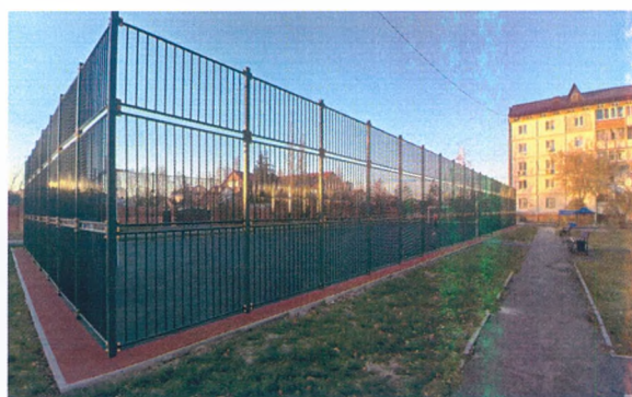
Спортивная площадка после ремонта

Ремонт объектов коммунального хозяйства требует значительных финансовых средств. За счет средств городского бюджета выполнены следующие работы: