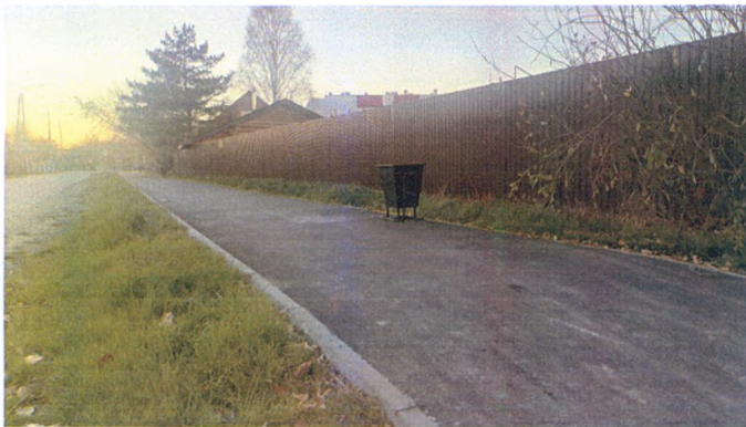
Тротуар по переулку Добрый (Антипино)

По обращению жителей района Антипино в 2022 году выполнено устройство тротуара по переулку Добрый от примыкания к ул. Ивана Крылова до ул. Добрая.