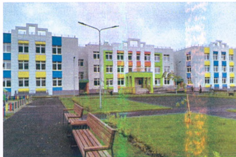
Детский сад в Антипино, г. Тюмень

Детский сад рассчитан на 14 групп: три ясельные группы по 18 детей, три – младшего возраста по 24 ребенка; три – среднего возраста; три – старшего возраста; две – подготовительные.