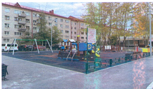
Благоустройство двора на ул. Мельникайте, д.95, 95а

На мой адрес поступали многочисленные обращения жителей домов № 46 и № 48 на ул. 50 лет Октября с просьбой о благоустройстве их двора. В результате совместной работы с организацией, управляющей данными домами, и Управой Ленинского округа города Тюмени данная дворовая территория включена в план благоустройства на 2023 год.