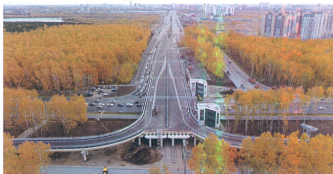
Транспортная развязка на ул. Мельникайте и ул. Дружбы