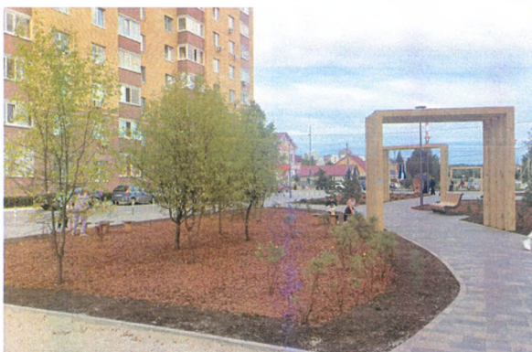
ул. Линейная, 15-17, г. Тюмень

В Тюменской области партийный проект реализуется за счет федерального, областного и местных бюджетов.