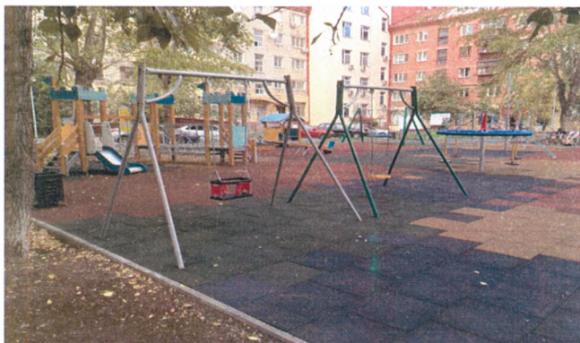
ул. Котовского, д. 52, г. Тюмень

Проект «Городская среда» реализуется в рамках регионального проекта «Формирование комфортной городской среды». В 2021 году, финансирование данного проекта составило 579 млн. рублей, в том числе средства федерального бюджета – 181 млн. рублей. В отчетном периоде были подведены итоги реализации проекта в Тюменской области за 2021 год.