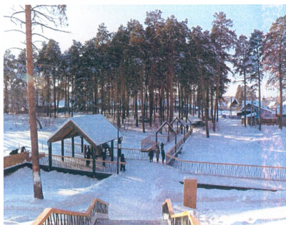
Центральный парк, город Заводоуковск

В 2021 году в рамках проекта выполнено благоустройство территории Центрального парка с прилегающими улицами Шоссейная и Парковая в городе Заводоуковск Тюменской области. Заявка на проект благоустройства Центрального парка в 2020 году была признана победителем по итогам Всероссийского конкурса лучших проектов создания комфортной городской среды в категории «Малые города» от Тюменской области и из федерального бюджета было выделено 70 млн. рублей.